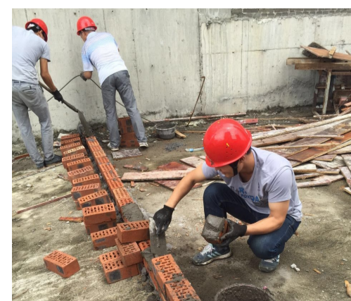
地下室坡道防汛封堵