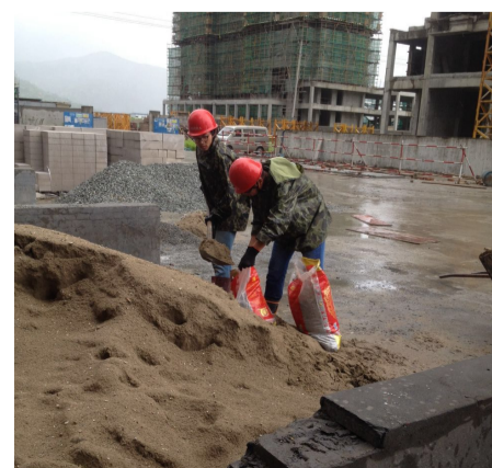
应急小组灌装沙包