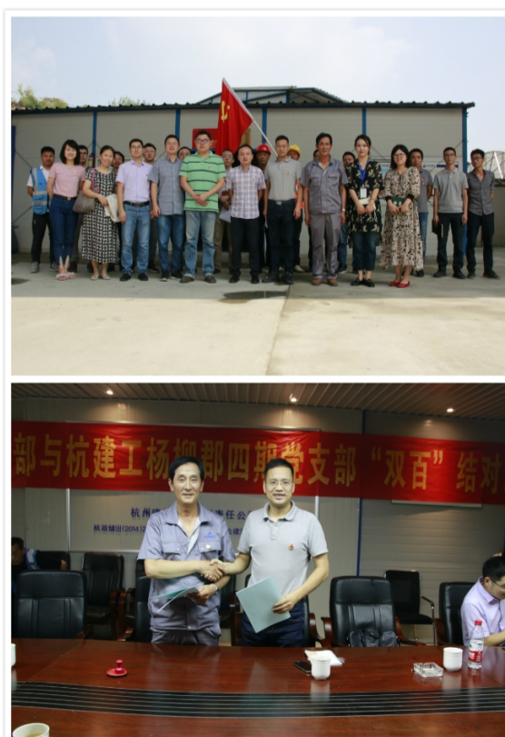
个支部结对百个工地”协议书,并合影留念。