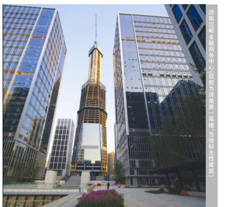
济南汉峪金融商务中心项目开发运营第一高楼(当地标志性建筑)

人类,总在梦想里迸发力量。企业,总在前进中铸就辉煌。众所周知,在建筑业中安装市场竞争非常激烈,业务承接日趋困难,利润空间越来越小,想要发展下去就必须寻找新的出路。为此,根据市场环境,杭安公司确立了“走出浙江、布局全国”的战略目标,积极开拓区域市场,参与省外市场竞争与合作。