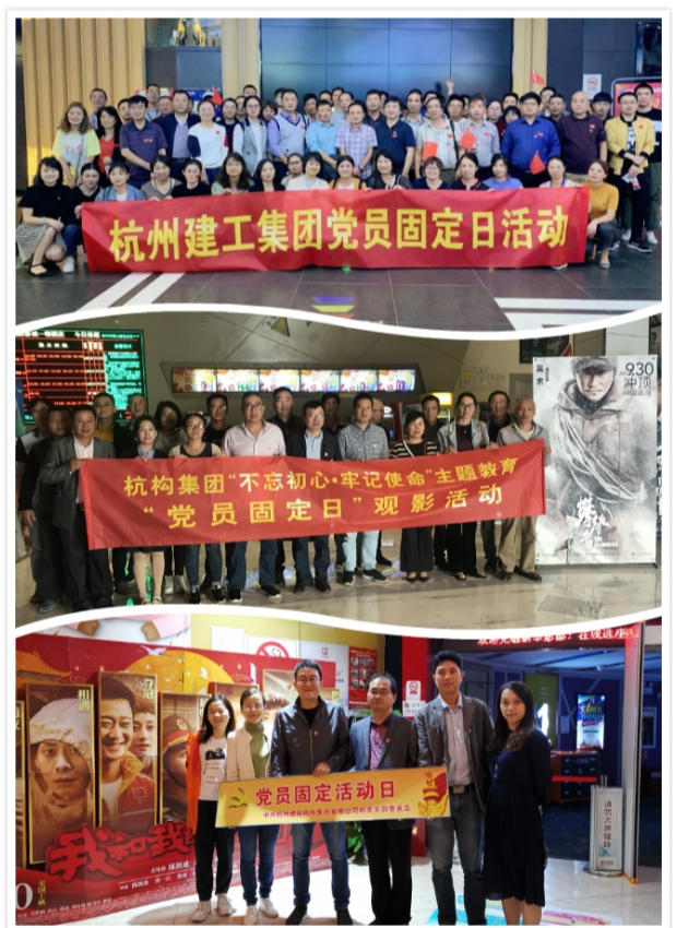
行动，为祖国的现代化建设尽一份自己的力量。(综合办 沈岑)

七十年来，我们祖国面临过各种困难和危机，但是一股核心的力量把我们人民的心聚集在了一起，顽强不屈地去消灭困难，坚定不移地去解决危机。在新中国成立七十年的日子里，通过观看这样一部影片，广大党员认识到要发自内心地去爱这个国家，深切地去认同这个国家，然后付诸于